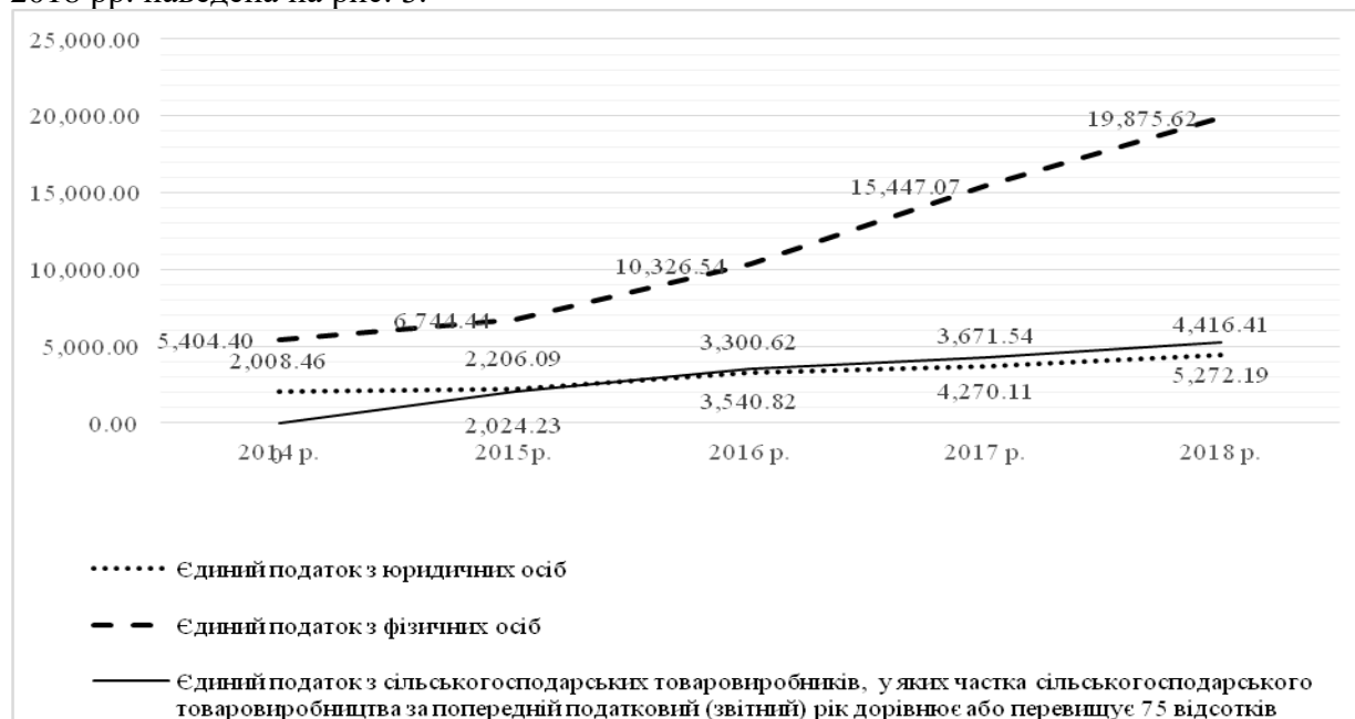
Рисунок 3 – Динаміка надходжень єдиного податку до місцевих бюджетів України (побудовано за даними [2, 3])

Динаміка надходжень єдиного податку від юридичних і фізичних осіб у 2014-2018 рр. наведена на рис. 3.