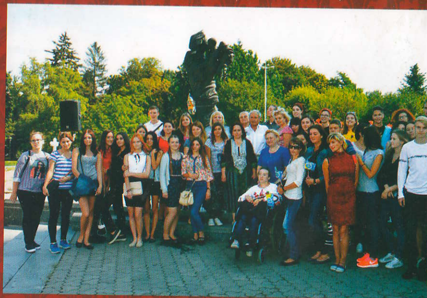
Студенти і викладачі Донецького національного університету ім. В. Стуса біля пам'ятника поетові

«До наших перших млявих літературних спроб Духовний ставився, здається, як до звичайних собі версифікаційних вправ – майбутні ж філоло-