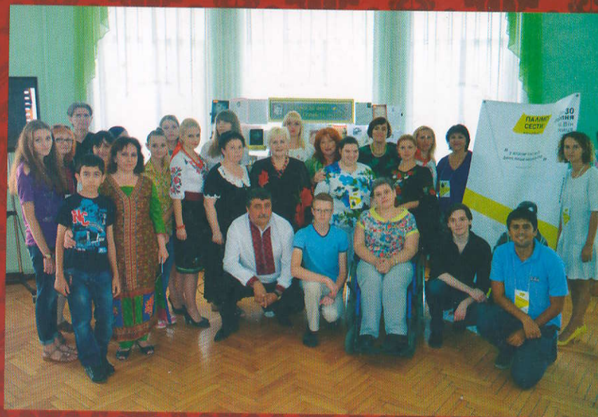
Учасники Всеукраїнського фестивалю #stusfest «Палімпсести», що відбувався впродовж двох днів у Вінниці 2015 р.