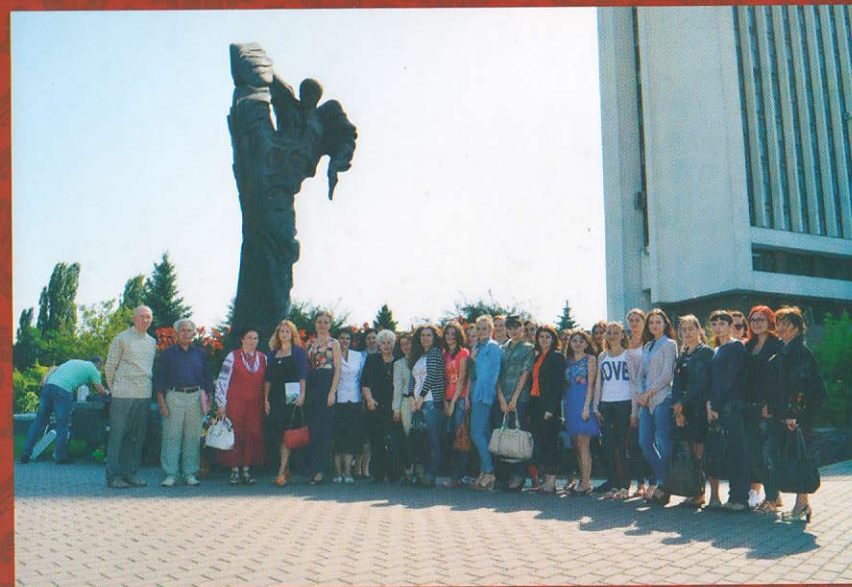
Площа ім. В. Стуса у Вінниці – улюблене місце зустрічі шанувальників поезії