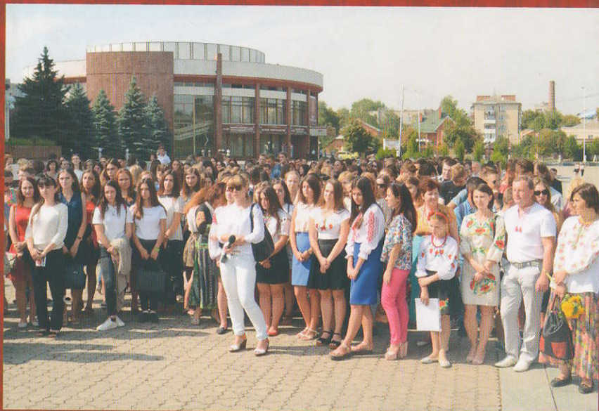
Студенти та викладачі ДонНУ разом з представниками громадськості м. Вінниці вшановують пам'ять борця за Україну