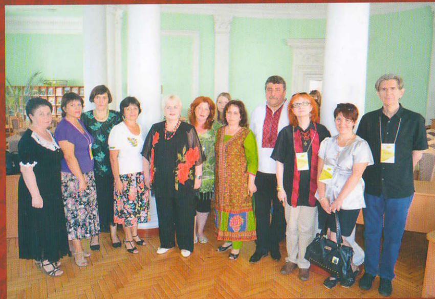
Учасники Всеукраїнського фестивалю #stusfest «Палімпсести»

У вересні 2002 року було відкри- то Донбаський історико-літературний музей В.Стуса – перший в Україні, що працював на громадських засадах у Горлівці, де довелося поету вчителю- вати. Ініціював його створення підпол- ковник міліції Олег Федоров. Проте в 2012 році у зв'язку з погіршенням стану здоров'я засновника цінні експ- онати цього музею були перевезені