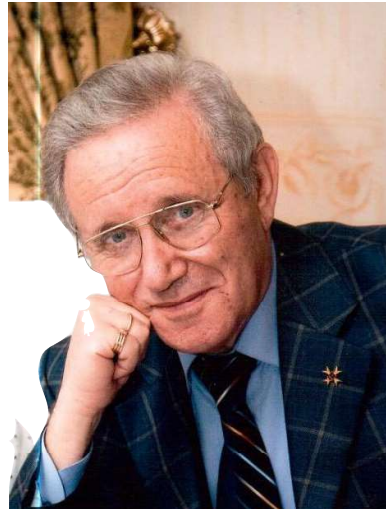
Й. Л. Бронз

Так само, відповідно до статті 6 КАС України, суд застосовує принцип верховенства права з урахуванням судової практики ЄСПЛ .