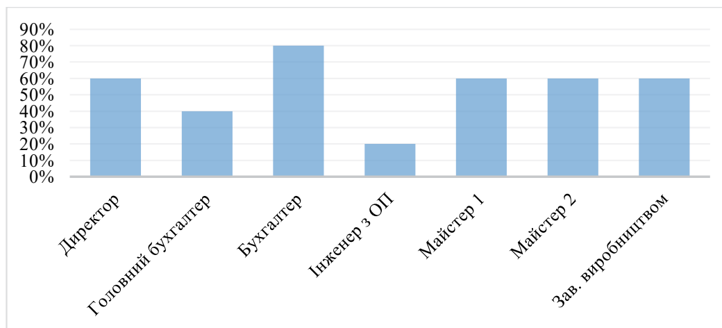
Рис. 2. Рівень схильності керівних посад до ризику