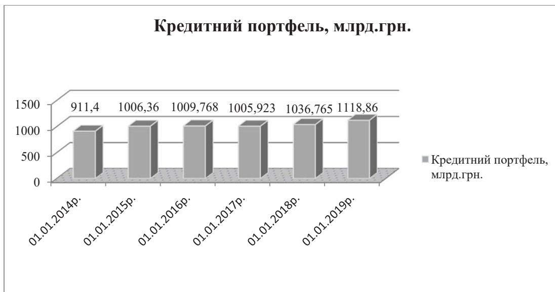
Рис. 1. Динаміка кредитного портфеля банків України з 01.01.2014 по 01.01.2019 р.

Динаміка обсягів кредитного портфеля банків України наведена на рисунку 1.