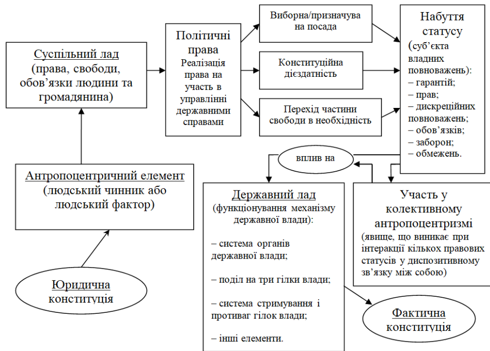
Рис. 1. Теоретичне визначення місця та ролі антропоцентризму суб'єктів публічної влади в конституціоналізмі сучасної держави (де місце визначається між суспільним і державним ладом, а роль – у процесі переходу юридичної конституції у фактичну)

Виходячи з вищевикладеного, також можна дати визначення даних процесів. Ураховуючи елемент суспільного ладу та державного ладу, а також наведену формулу конституціоналізму (конституційно-правова норма + практика її реалізації), антропоцентризм у сучасному конституціоналізмі (у конституційному праві) – це явище, що визначає людину (та її юридично обумовлену поведінку) сутністю суб'єкта практичної реалізації норм конституційного права. Цей підхід означає, що держава функціонує не через органи, інститути чи організації, а через громадян, наділених статусними повноваженнями (або політичними правами, якщо це стосується функціонування політичних партій) суб'єктів публічної влади. Такий підхід повинен бути першочерговим у самому розумінні (науково-доктринальному, загально-правовому або теоретично-правовому) органу як частини державної структури (можливе також зазначення у правових дефініціях). У такий спосіб державний орган не буде абстрактно-функціонуючим елементом механізму (чим віддаляє розуміння держави від існування особи-громадянина, виключаючи його як віху всього функціоналу), але набуде екзистенційно-змістовного наповнення, а визначення та розуміння Т. Гоббсом людини як творця і розпорядника держави посяде належне місце в сучасній юридичній доктрині [24, с. 296].