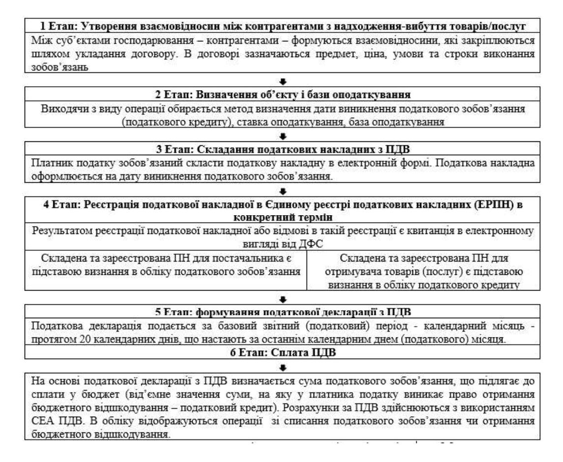
Рисунок 1. ПДВ: загальні етапи циклу обліку, звітності, сплати [1]

На основі формування взаємовідносин з контрагентами будується цілісний процес відображення в податковому обліку розрахунків з ПДВ, який складається з певних етапів (рис. 1).