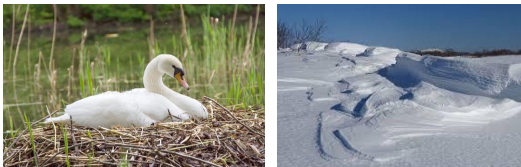
Рисунок 1 – Белый лебедь и снег

В качестве примера представим когнитивно-культурологическое описание загадки русского народа о снеге – Белый лебедь на яйцах сидит (снег на полях) [2, № 1971].