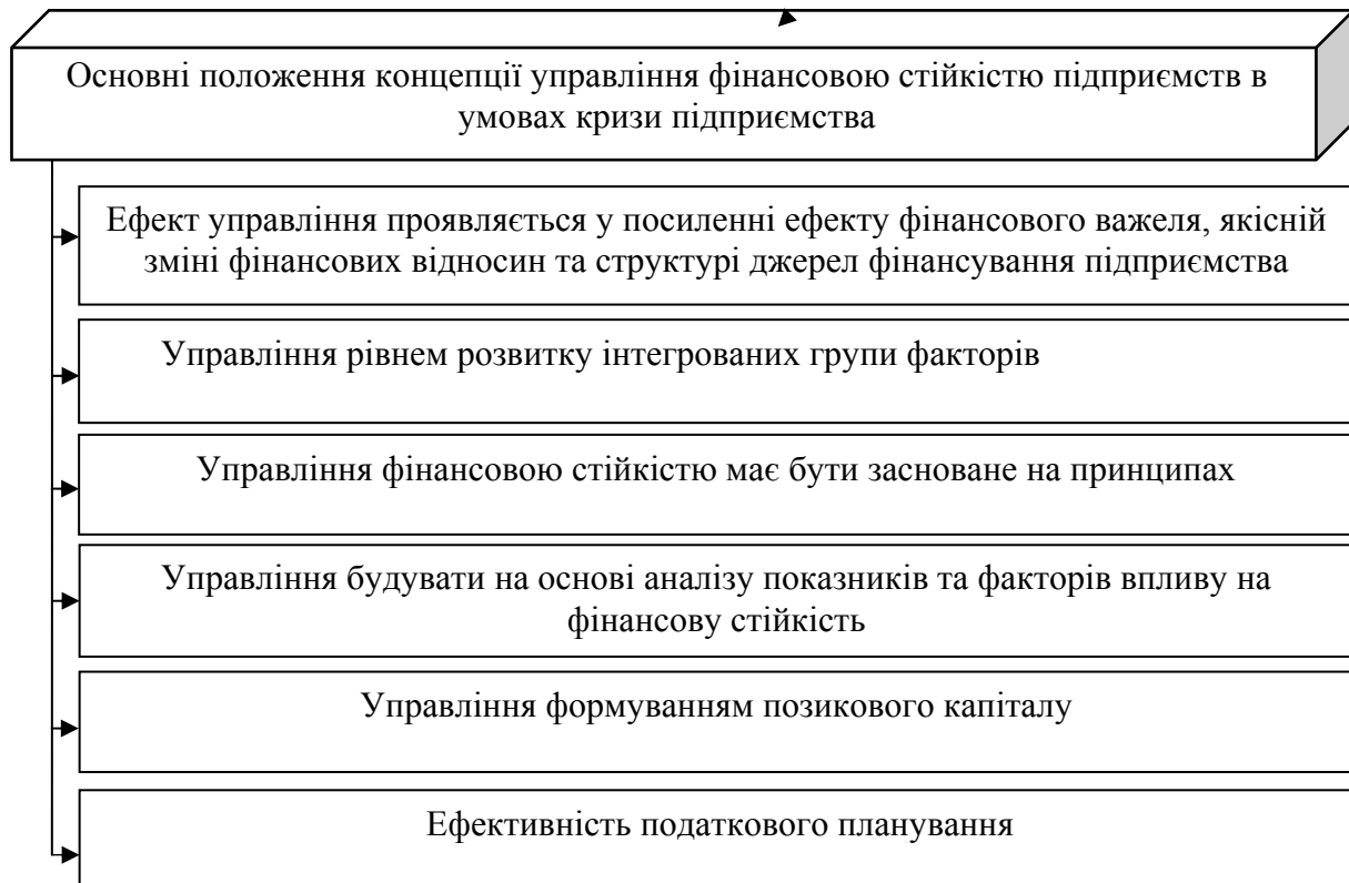
Рис. 1. Основні положення концепції управління фінансовою стійкістю підприємств

Так, основні положення концепції згруповано на рис. 1.