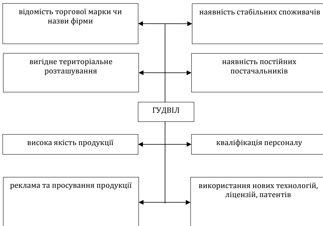
Рис. 1. Складові компоненти гудвілу

показника для розробки стратегії впливу на його складові та підвищення інвестиційної привабливості компанії.