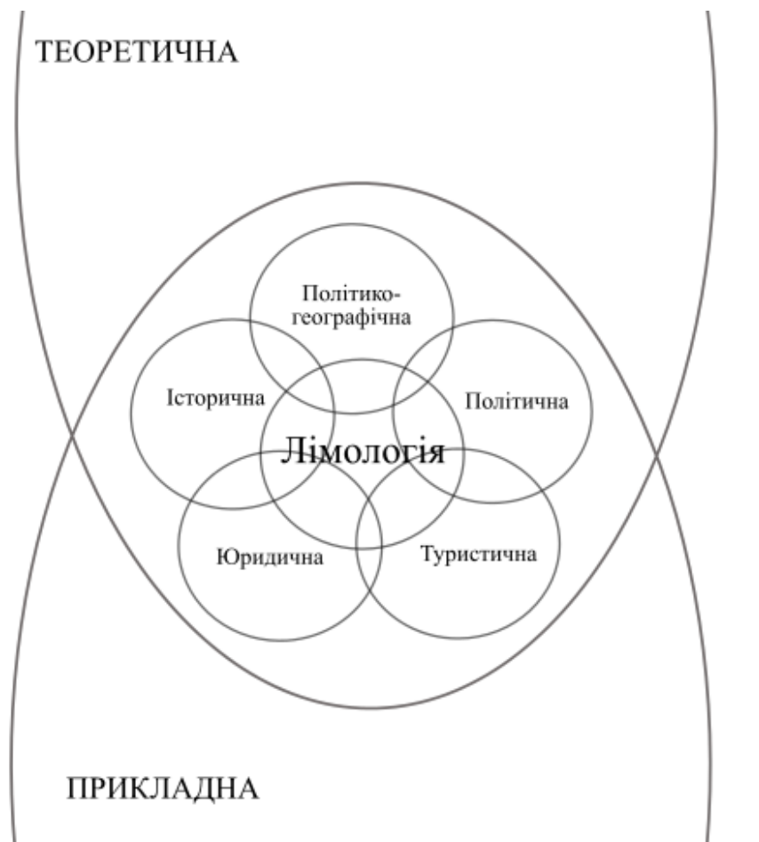
Рис. 1. Схема структуризації лімологічної науки*