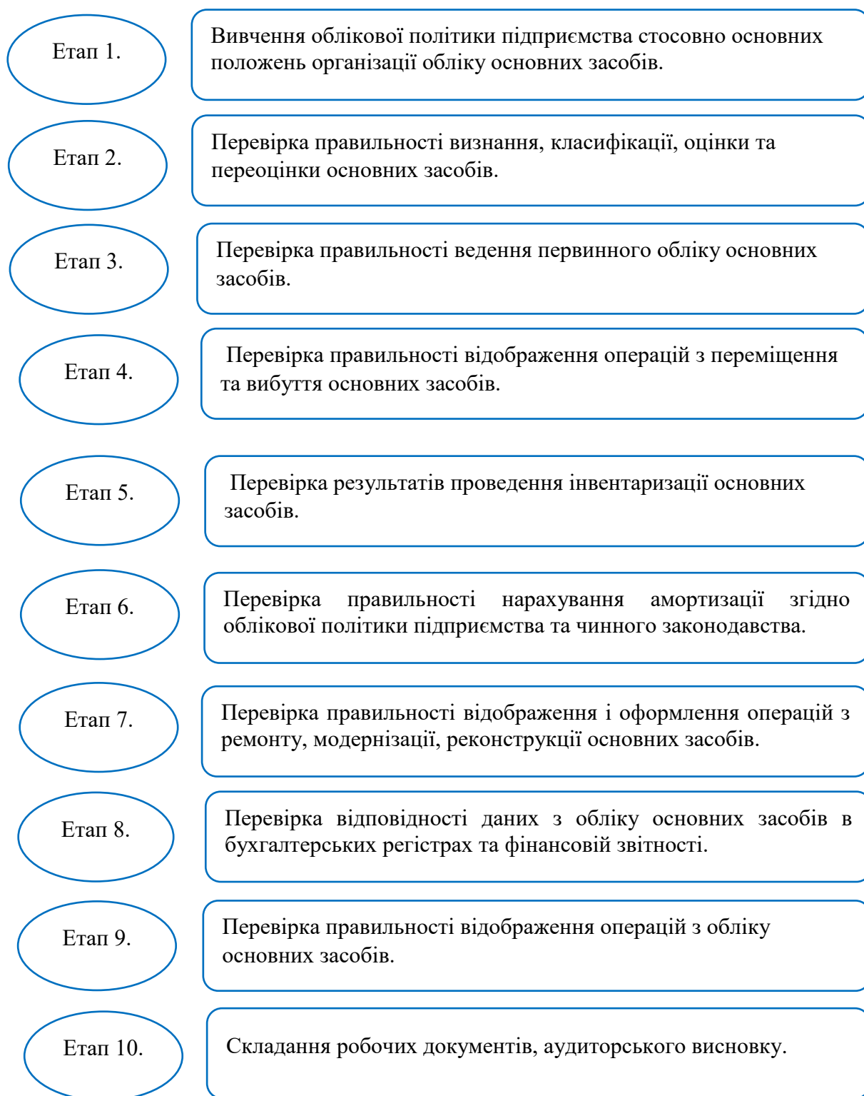
Рисунок 1 - Послідовність проведення аудиту операцій з обліку основних засобів [9]

Найперше, що підлягає вивченню при аудиті основних засобів – це облікова політика підприємства. Тому, що перед тим як перевіряти як здійснюється облік треба перевірити як цей облік на підприємстві організований. В обліковій політиці у